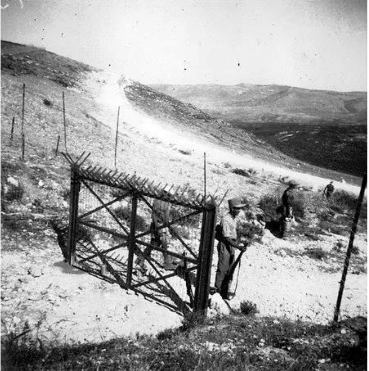
ملحق رقم (٢) صورة عند الحدود اللبنانية الفلسطينية ١٩٣٧-١٩٣٨