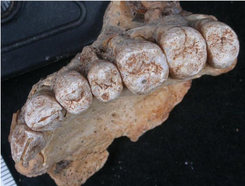
صورة 3 تم اكتشاف هذا الفك والاسنان سنة 2002 م في كهف ميسليا في الجانب الغربي لجبل الكرمل في فلسطين وهي تعود الى 177000 - 194000 سنة قبل الميلاد ، نقلاً عن : www.livescience.com . Human history gets longer