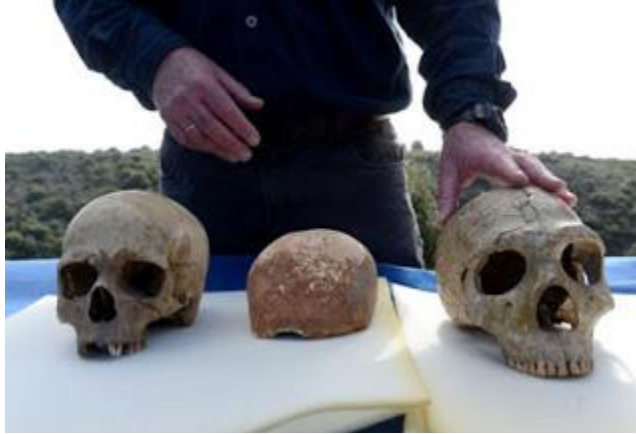
صورة 1 جماجم عثر عليها في مغارة السخول جنوب الطابون في جبل الكرمل جنوب حيفا سنة 1925 م وهي تعود الى مئة الف (100.000) سنة نقلاً عن : تاريخ فلسطين القديم - مملكة اسدود

لقد أكدت المكتشفات التي عُثر عليها في مغارة العبيدية الواقعة في جنوب غرب بحيرة طبرية في جبل الكرمل في فلسطين ، والمتمثلة بمصنوعات صوانية وبهيكل عظمي لإنسان يعود الى حوالي مليون وخمسمائة ألف سنة ، وغيرها من الكهوف المنتشرة في فلسطين منها مغارات :