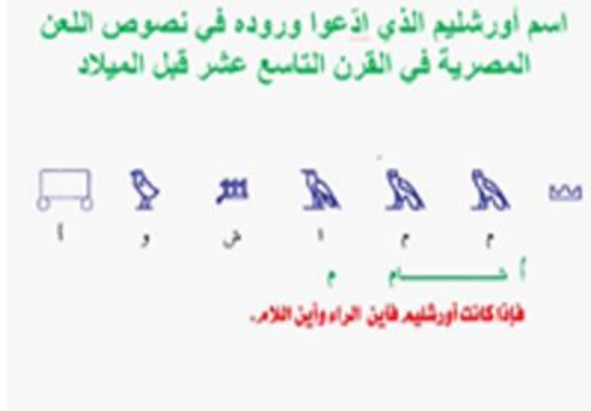
صورة 4 نقلًا عن محمد بهجت القبسي: تصحيح القراءة في النصوص الاثرية. مؤسسة القدس للثقافة والتراث

وقد قام العالم الألماني كورت سيث K. sathe بترجمة والتعليق ونشر المجموعة الأولى منها سنة 1926 م، وعرفت بنصوص برلين، كما نشر جورج يوسنيه المجموعة الثانية سنة 1957 م وعرفت بنصوص بروكسل، وذكرت هذه النصوص أسماء حوالي عشرين مكاناً أو مدينة مصرية