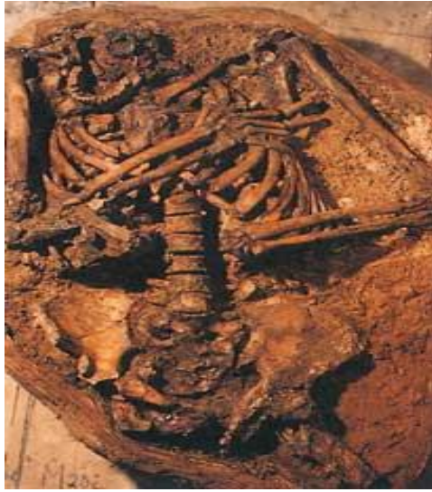
صورة 2 عُثر على هذا الهيكل في كهف كباره في قرية كباره في جبل الكرمل قرب حيفا ، وهو يعود الى 60000 (ستين الف) سنة.