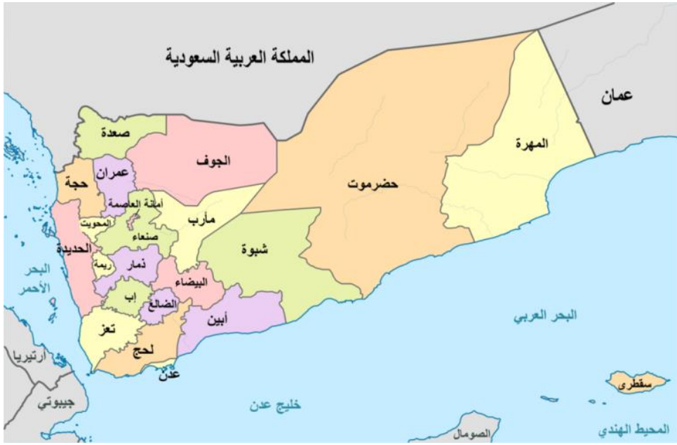
صورة 11 التقسيم الإداري في اليمن