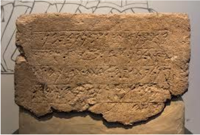
صورة 10 نقش عقرون نقلاً عن : الحلقة المفقودة والدين المختطف . ص 61.

وقد جاء نص النقش حسب قراءة سيمور غتن وزميليه على الصورة التالية : " بت . بن . أكيش . بن . فدي . بن . يسد . بن . أدا . بن . يعر . شرعقرن . لفتيه . أدته . تبركه . وتسموه . وتأرك . يمه . وتبارك . رشه . " . وجاءت قراءتهم للنقش عند زكريا محمد في نفس كتابه . ص 43 على صورة : ( 1 - بيت . بن . أكيش . بن . بدي . بن . 2 - يسد . بن . أدا . بن . يعير . سرعقرن . 3 - ل بتجيه . سيدته . تباركه . وت 4 - حميه . وتطيل . يومه . وتبارك . 5 - أرضه . ) . بينما قرأ هو نفسه النقش كما يلي : ( بيت بناه أكيش بن بادي . بن يسد . بن أدا . بن يعير . سري الصقران . لمعظمة الطيايا سيدته لتباركه وتحميه وتطيل عمره وتبارك ملكه ) . ( 121 )