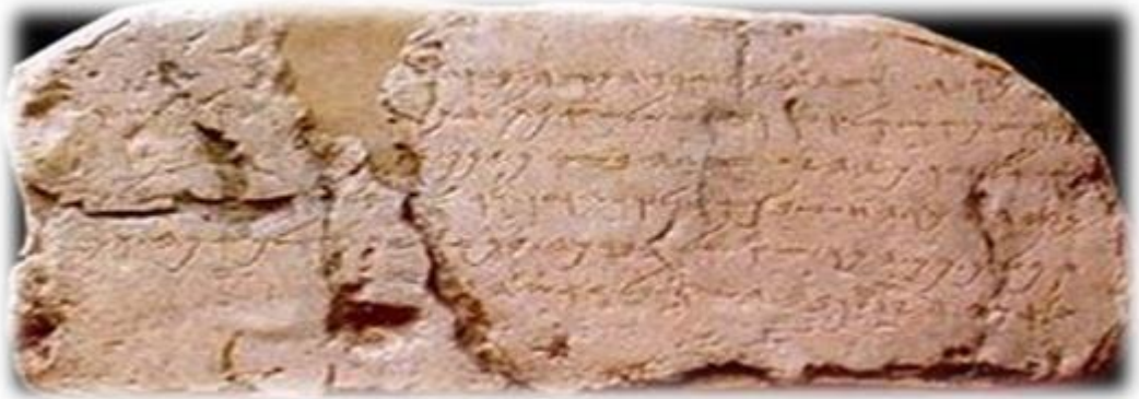
صورة 7 نقش شيلوه أو نقش حزقيا أو نقش سلوان.