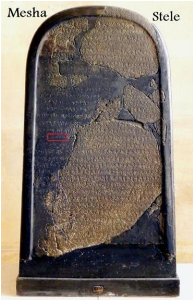
صورة 6 نقلاً عن : ضرغام فارس : إسرائيل...ثوب حق يرتديه رجل زائف . دنيا الوطن . 18 / 01 / 2016.